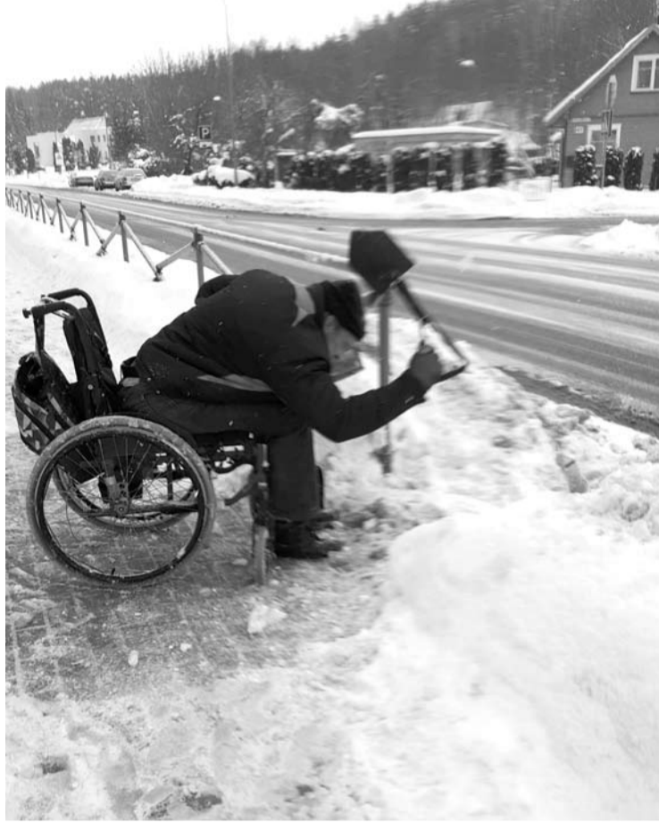
Neįgaliesiems asmenims prastai valomos gatvės bei šaligatviai šią žiemą ypač sunkiai įveikiami.

„Neįgalusis su vežimėliu išvažiavo Liudiškių gatvėje ant