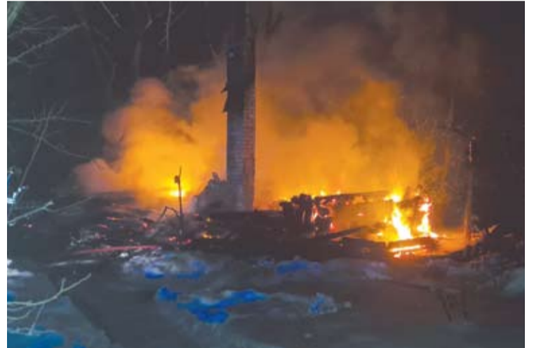
Gaisras Andrioniškio seniūnijos Zabelynės kaime suniokojo renovuotą namą.

„Geriau padaryti daugiau nei reikia, užuot vėliau gailėjusis, kad kažko nepadarei“, - kodėl vienu metu gaisravietėje dirbo net trys policijos ekipažai, aiškino Utenos apskrities vy-