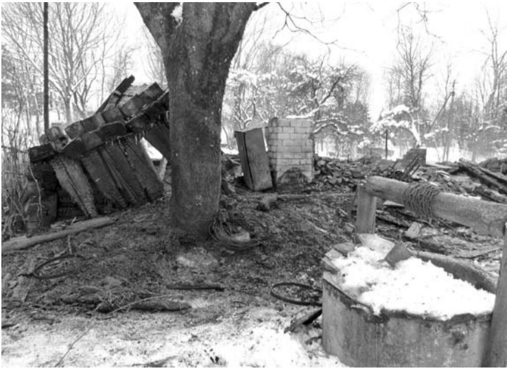
Skiemonių seniūnijoje gaisras greičiausiai kilo nuo krosnies.