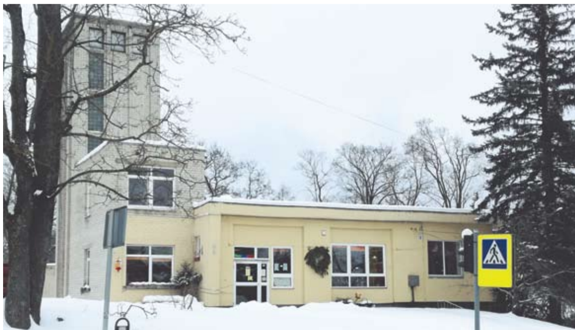
Buvusi senoji gaisrinė tapo maisto prekių parduotuve.

Senosios Anykščių gaisrinės pastato nuomininkui - ūkininkui Algiui Bukauskui - už pagrindinių nuomos sutarties sąlygų pažeidimą skirta 10 tūkst. Eur bauda.