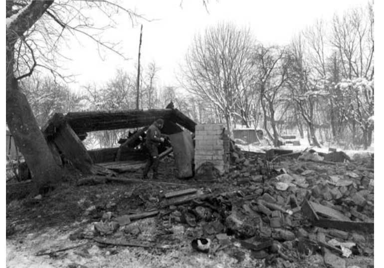
Ugnis visiškai suniokojo didžiulį dviejų galų medinį namą.