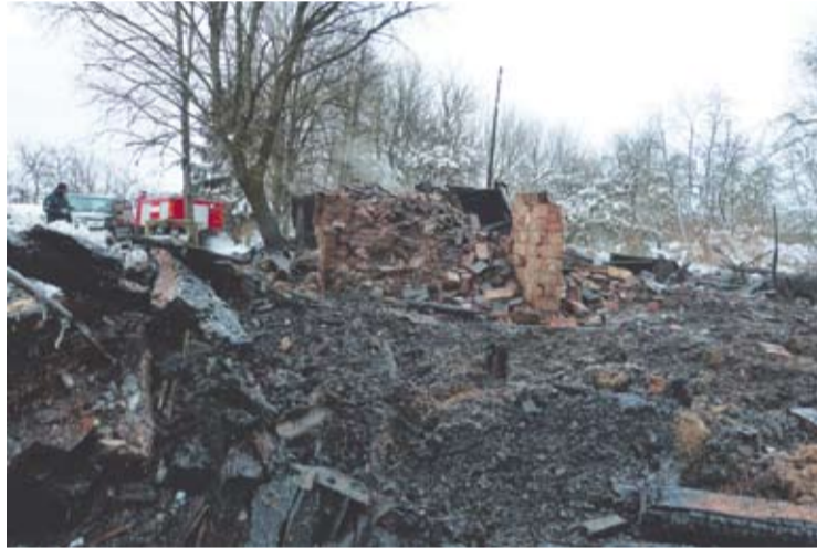
Skiemonių seniūnijoje Vildiškių kaime per gaisrą žuvo 63 metų vyras ir į dešimtą dešimtį įkopusi jo motina.

Naktį iš sekmadienio į pirmadienį per gaisrą Skiemonių seniūnijos Vildiškių kaime žuvo 63-ejų metų vyras ir jau į dešimtą dešimtį įkopusi jo motina. O šeštadienį, vasario 13-ąją suplekėjo namas Andrioniškio seniūnijos Zabelynės kaime.